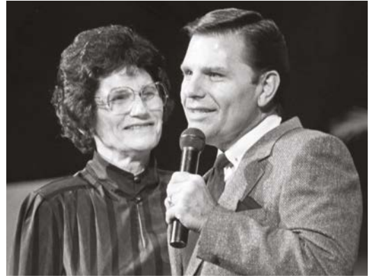
Vinita et Kenneth Copeland, ensemble sur scène dans les années 80.

Par Sa mort et Sa résurrection Jésus a fait bien plus que payer le prix pour que nous soyons pardonnés de nos péchés. Il a complètement anéanti Satan et ses armées démoniaques. Il a