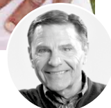
par Kenneth Copeland