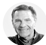
par Kenneth Copeland

« L'espérance biblique authentique est vraiment merveilleuse. C'est plus que simplement espérer ; elle relève d'une attente pleine de confiance »