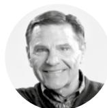
par Kenneth Copeland