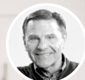
par Kenneth Copeland