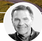
par Kenneth Copeland