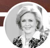
par Gloria Copeland

UNE DES CHOSES QUE J'APPRÉCIE EN CE QUI CONCERNE DIEU, C'EST QU'IL REND LES CHOSES SIMPLES POUR NOUS. CONTRAIREMENT AU MONDE, EN VUE DE RÉUSSIR, IL NE NOUS COMPLIQUE PAS L'EXISTENCE AVEC TOUT UN TAS DE STRATÉGIES DIFFÉRENTES, ET PARFOIS CONTRADICTOIRES. DU DÉBUT À LA FIN DE LA BIBLE, IL NOUS DIT CONSTAMMENT DE TOUT SIMPLEMENT ÉCOUTER CE QU'IL DIT ET DE LE FAIRE.